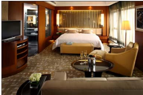
Executive Deluxe Room