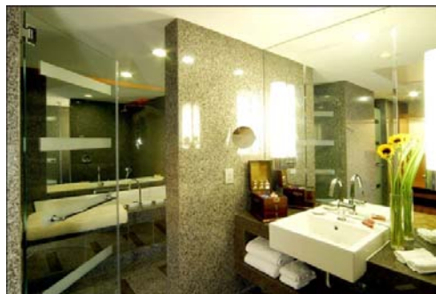
Executive Deluxe Room Bathroom